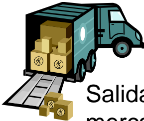
Salida de la mercadería